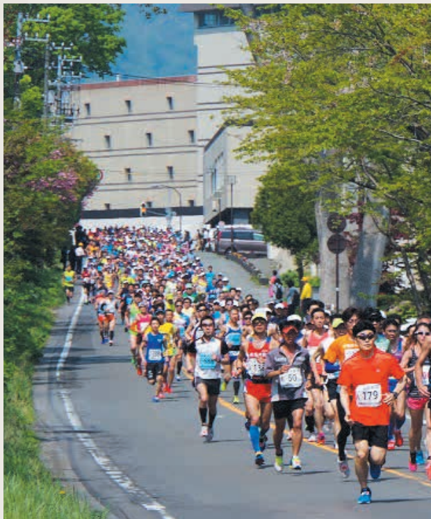
第44回洞爺湖マラソン 5月20日午前9時30分スタート 洞爺湖を一周する、国内最大規模のマラソン大会です。フルマラソンのほか10km・5km・2kmのコースがあります。参加申し込みは締め切れ、今大会のエントリー者数は6,736人。